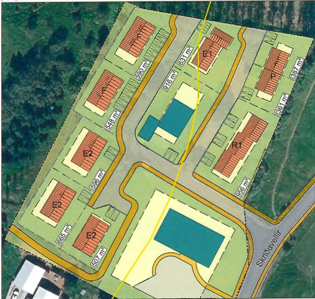
Samþykkt deiliskipulag frá 10.júní 2021, mkv. 1:1000 A3

Tveimur einbýlishúsalóðum breytt í tvær fjölbýlis- húsalóðir og 3ja íbúða raðhúsalóð breytt í 4ja íbúða raðhúsalóð og ákveðnum húsum breytt úr tveimur hæðum í eina hæð.