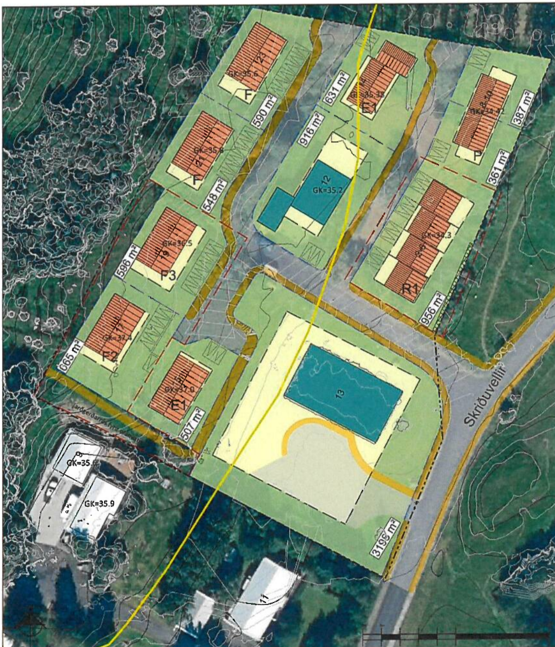
Tillaga að breytingu á deiliskipulagi í janúar 2022, mkv. 1:1000 A3