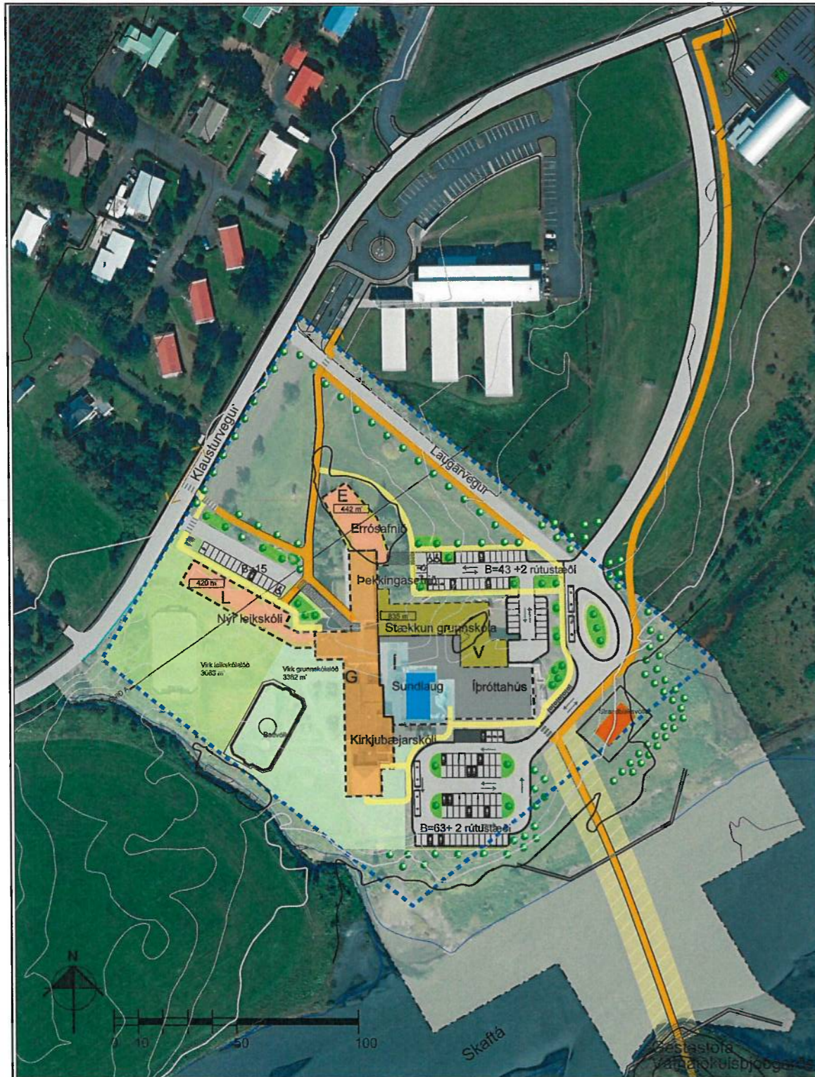
Tillaga að deiliskipulagi Klausturvegar 4 Mkv 1:1500