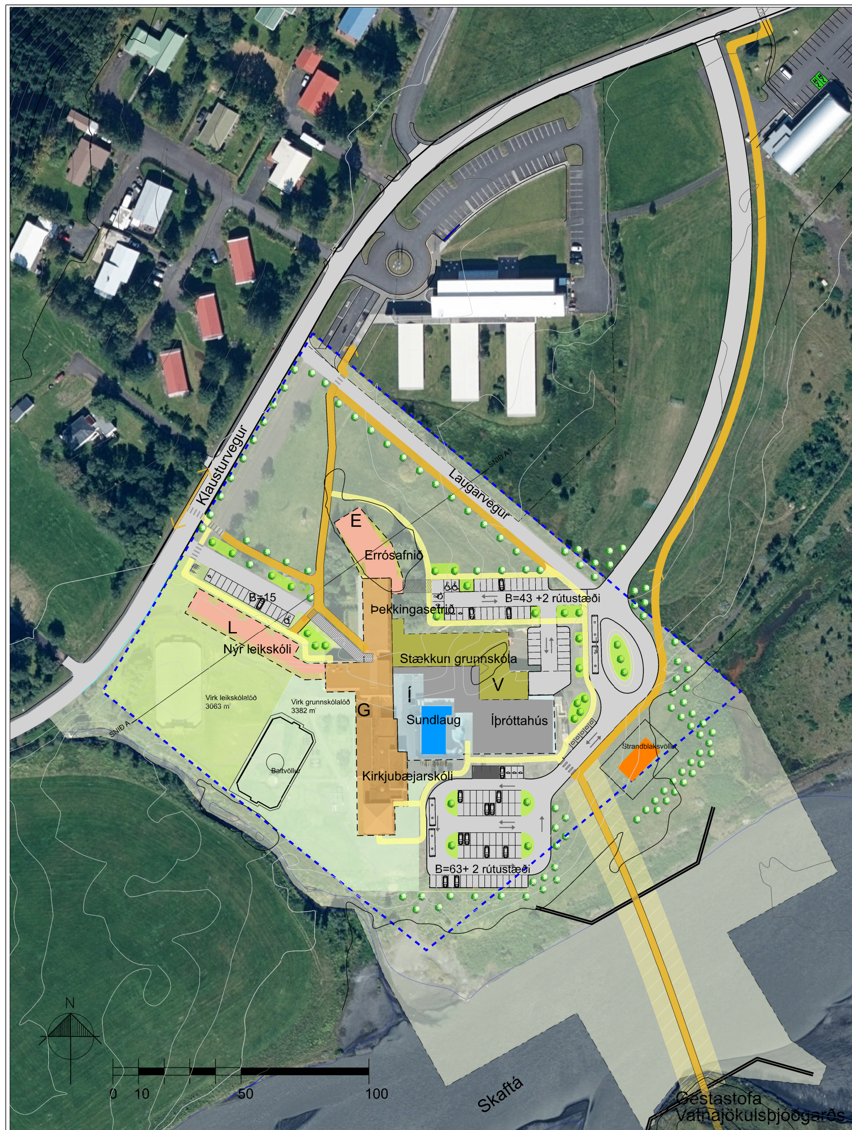
Tillaga að deiliskipulagi Klausturvegar 4 Mkv 1:1500