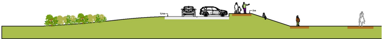
Mynd 4. Snið í gegnum bílastæði og mæn fyrir áhorfendur við keppnissvæði.