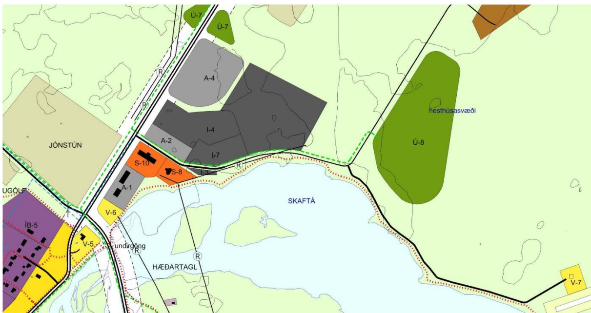
Mynd 1. Aðalskipulag Skaftárhrepps 2010-2022, Ú-8 er deiliskipulagssvæðið.

Deiliskipulagið er í samræmi við gildandi aðalskipulag Skaftárhrepps 2010-2022 þar sem á þéttbýlisuppdrætti fyrir Kirkjubæjarklaustur er skilgreindur er 6,5 ha reitur Ú8 fyrir Hesthúsasvæði á Stjórnarsandi. Allar megin forsendur skipulagsins liggja fyrir í aðalskipulagið og því var ekki gerð skipulagslýsing. Deiliskipulag þetta fellur ekki undir lög um umhverfismat áætlana nr. 105/2006.