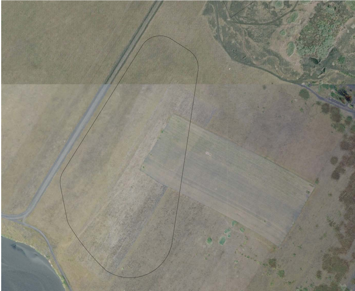
Mynd 2. Loftmynd af skipulagssvæðinu