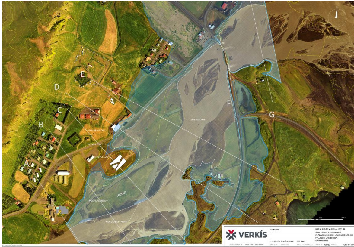
Mynd 1. Áhættumat vegna flóða tillögur að vörnum með eldri staðsetning á Þekkingarsetri (VERKÍS 2012).

Flóðagreining var unnin af VERKÍS fyrir svæðið, sjá mynd 4. Hafa ber í huga að staðsetning þekkingarseturs á myndinni er samkvæmt eldri tillögu á mikilli landfyllingu. Hinsvegar má sjá hvernig reiknað er með að flóð úr Skaftá fari, ljósblár er 10 ára flóð, blá er 100 ára flóð og dökkblár er 1000 ára flóð. Á myndinni má sjá að syðsta svæðið milli félagsheimilis og hótels er á flóðasvæði og því verða byggðar varnir til að verja svæðið en svæðið er að mestum hluta fyrir ofan hættusvæði flóða.