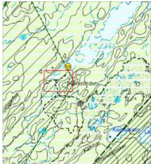
Mynd 3. Aðalskipulag Skaftárhrepps 2010-2022.

Það er í höndum sveitarstjórnar að ákveða hve víðtækt kynningarferlið skal vera áður en sjálf deiliskipulagstillagan verður auglýst.