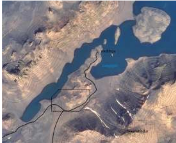
Mynd 1. Fyrirhugað deiliskipulagssvæði við Langasjó.

Langisjór og nágrenni hans eru innan Vatnajökulsþjóðgarðs skv. reglugerð nr. 764/2011. Þetta svæði tekur til náttúruminja sem taldar eru hafa mikið gildi á heimsvísu, auk mikils útivistargildis. Svæðið hefur að geyma víðerni og einstakar jarðmyndanir sem tengjast eldvirkni á löngum gossprungum. Meðal þeirra eru móbergshryggirnir Grænifjallgarður og Fögrufjöll, sem mynduðust við gos undir jökli. Langisjór er eitt stærsta ósnortna stöðuvatn á hálendi landsins, um 25 km 2 .