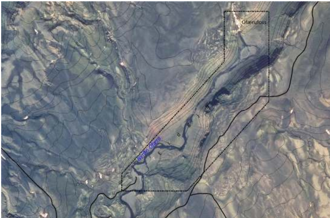
Mynd 1. Fyrirhugað deiliskipulagssvæði í Eldgjá.

Vatnajökulsþjóðgarður áformar að koma upp aðstöðu fyrir ferðamenn í Eldgjá. Lagt verður mat á hvort ástæða sé til að gera ráð fyrir aðstöðuhúsi fyrir landverði, nýtt og/eða endurbætt snyrtihús, setja upp upplýsingaskilti og afmarka bílastæði. Skipulagið tekur einnig til göngu- stígagerfis um svæðið og endurbóta á tröppum við Ófærufoss og gíg ofan við snyrtihúsið.