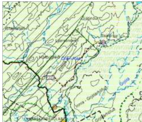
Mynd 3. Aðalskipulag Skaftárhrepps 2010-2022.

Það er í höndum sveitarstjórnar að ákveða hve víðtækt kynningarferlið skal vera áður en sjálf deiliskipulagstillagan verður auglýst.