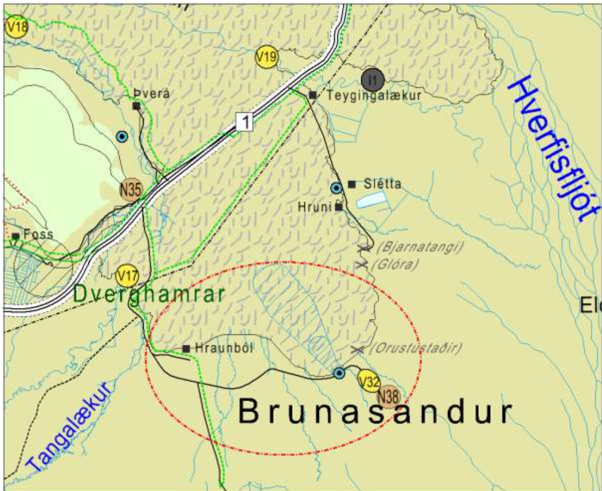
Mynd 1. Yfirlitsmynd af Aðalskipulagi Skaftárhrepps 2010-2022.

Í Aðalskipulagi Skaftárhrepps er svæðið skilgreint sem verslunar- og þjónustusvæði, reitur V32, sjá mynd 1. Í ákvæðum aðalskipulagsins segir að svæðið sé 15 ha þar sem gert er ráð fyrir hóteli og tengdri starfsemi, áætlað byggingarmagn er um 7.000 m 2 á tveimur hæðum. Gerð er krafa um þriggja þrepa hreinsistöð fyrir fráveitu. Til þess að tryggja öryggi sjaldgæfra fuglategunda mælir Skaftárhreppur með því að dvöl katta og hunda verði takmörkuð á svæðinu.