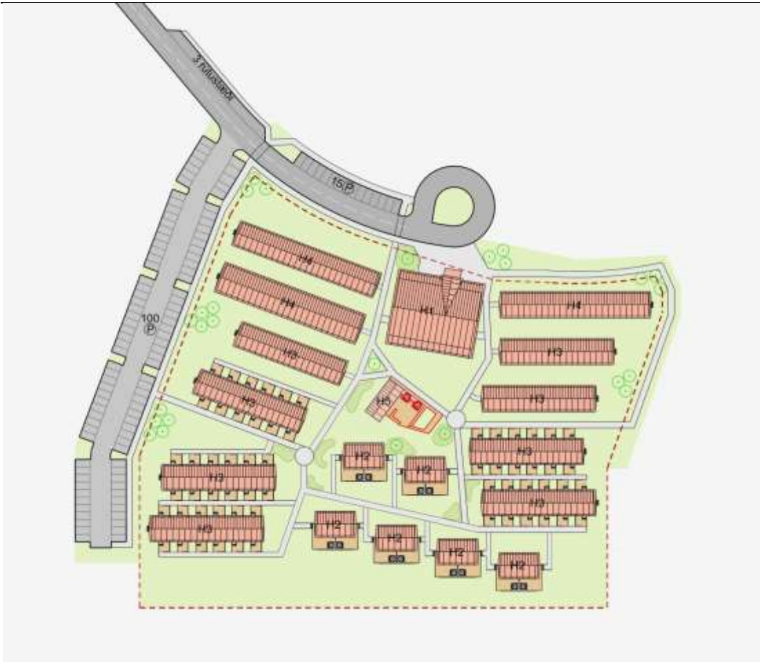
Mynd 5. Skýringarmynd af húsagerðum á byggingarreit 1.