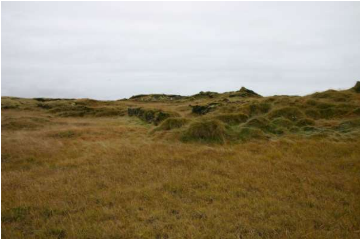
Mynd 2. Myndir af minjum við Fjánhústanga.