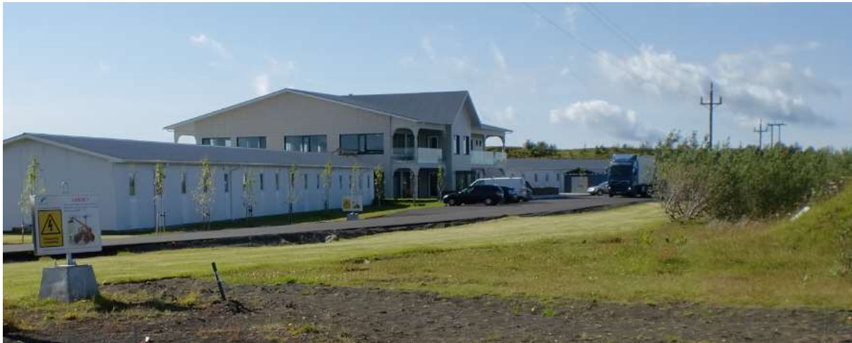
Mynd 4. Sambærileg bygging á Hellu.

Húsagerð 1. Hótelmóttaka og veitingaaðstaða. Steypt tveggja hæða bygging samtals 1210 m 2 að stærð með lágt ris. Mænishæð allt að 10,5 m.