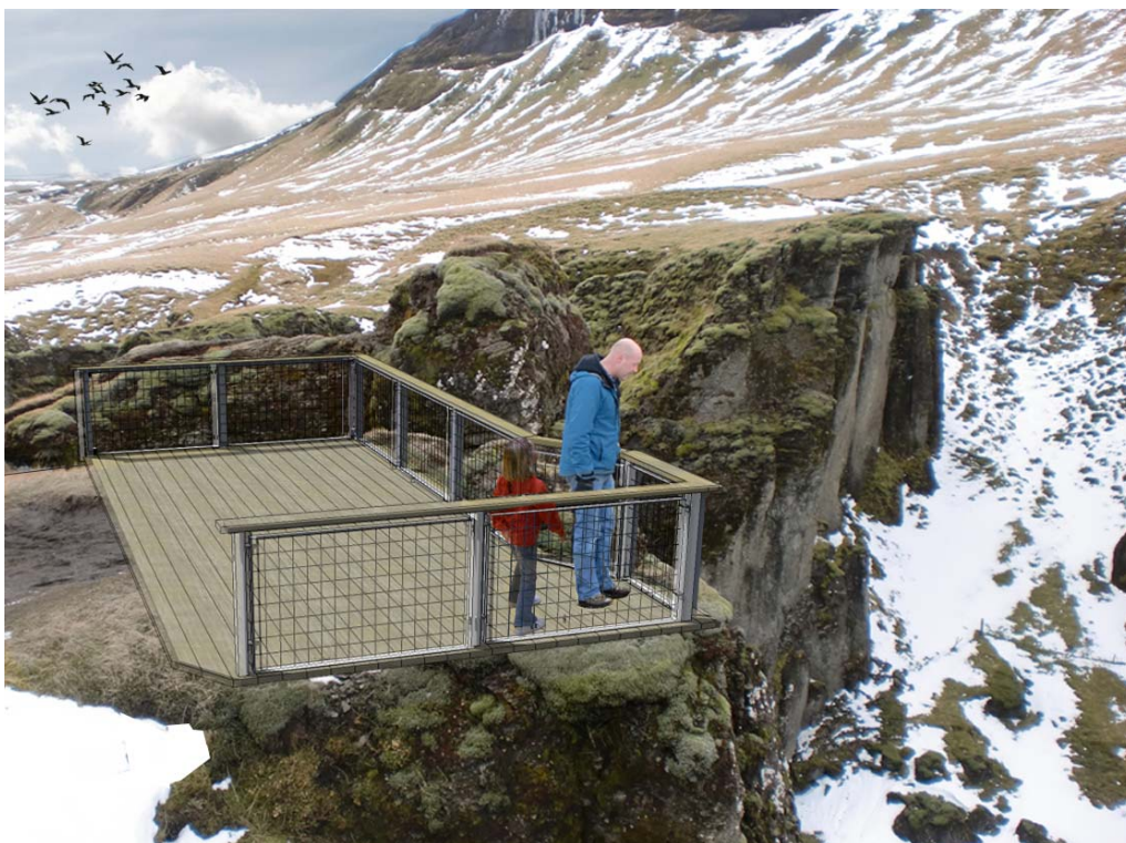
Dæmi um útfærslu á útsýnispalli við neðri hluta gljúfranna.