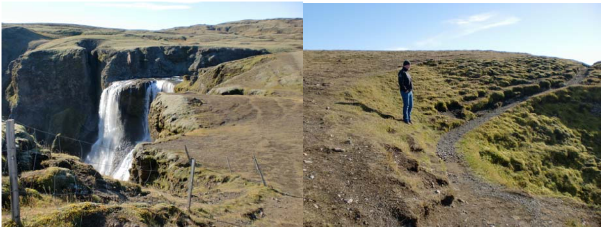
Fagrifoss. Myndirnar sýna bjargbrúnina þar sem setja þarf varnargirðingu og núv. gönguleið að útsýnisstöðum.

Fagrifoss í Geirlandsá er vinsæll áningarstaður ferðamanna á leiðinni inn í Laka. Frá Lakavegi, F206 er afleggjarinn að honum rúmur 150 m. Útísalerni hefur verið reist á flötum mel vestan aðkomuvegar þar sem það er í hvarfi frá útsýnisstað við Fagrafoss. Í aðalskipulagi Skaftárhrepps er svæðið skilgreint sem óbyggt svæði ofan 200 m y.s. en í markmiði aðalskipulagsins segir að stefnt verði að því að skipuleggja umferð á opnum svæðum m.t.t. álagsþols jarðvegs og gróðurs. Jafnframt verði unnið að skráningu náttúruvætta og menningarminja og merkingu gönguleiða.