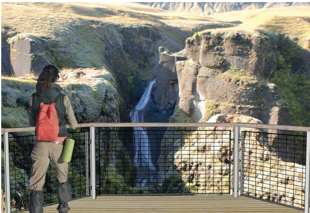
Dæmi um útfærslu á útsýnispalli á mótis við fossinn

Ruslafötur. Koma skal fyrir ruslafötum við salernishús og bílastæði og losa þær reglulega.