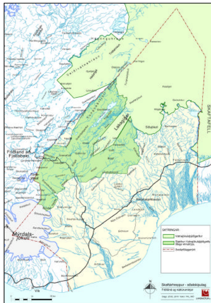
S tæ kku Vatnajökullsjógarðsskv. tilögu sveitarstjómar