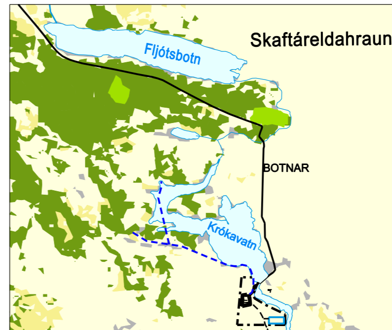
Gróðurkort frá Nýjalandi - Mkv: 1:25.000