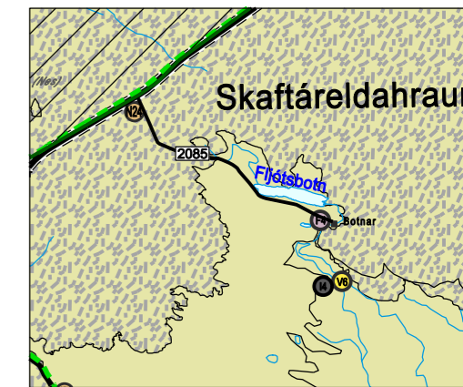
Hluti af staðfestu Aðalskipulagi Skaftárhrepps 2010-2022.

Ekkert kemur fram um frárennsli frá vinnsluhúsnæði. Staðsetning á rotþró og frárennslislögnum verður innan lóðar en er ekki sýnt á skipulagsupprætti. Þær verða staðsettar á byggingarnefndarteikningum þegar þær verða lagðar fyrir. Frágangur og gerð rotþróa og frárennslislagna skal gera í samræði heilbrigðiseftirlit og fara skv. reglugerð 796/1999 um fráveitur og skólp og leiðbeiningarit Umhverfisstofnunar frá 2004.