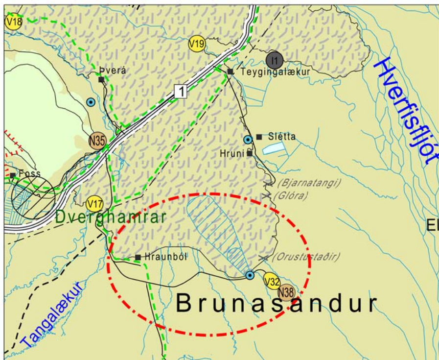
Breyting á aðalskipulagi Skaftárhrepps, mkv. 1:100.000.

Aðalskipulagsbreyting þessi sem auglýst hefur verið skv. 31. gr. skipulagslaga nr. 123/2010 var samþykkt í sveitarstjórn þann _____ 20 ____.